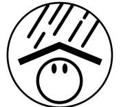
S'ABRITER Toiture Papillon triangle 96179