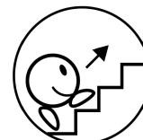
GRIMPER Rampe d'accès 0.50 96226