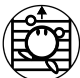
GRIMPER Echelle à grimper 0.90 96730