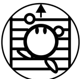
GRIMPER Filet incliné 1.35 97050