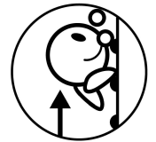
ESCALADER Voile de misaine 1.35 96830