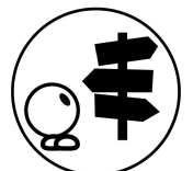
SE REPERER Toiture Mono A55-76